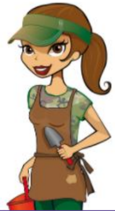
Marie-Anne geen diploma | fulltime droomjob harmonie in de tuin creëren